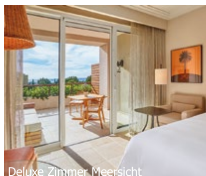
Deluxe Zimmer Meersicht